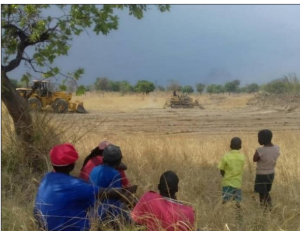
Le soutien de l'association a permis de louer des pelleteuses, nécessaires pour excaver la digue.

Grâce à la levée de fonds effectuée par notre association en 2017, le chantier de la digue et du bassin de retenue près de Mubaya est en passe d'être terminé.