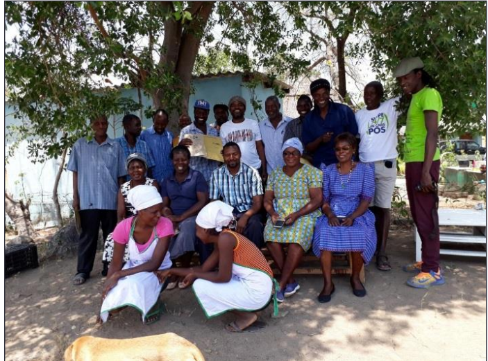
La formation a rassemblé 22 participants provenant de 16 hameaux voisins de l'écovillage.

Cet atelier participatif a permis aux habitant(e)s de renforcer leur esprit d'équipe et d'identifier les obstacles éventuels à l'établissement d'un écovillage composé de plusieurs hameaux à Mubaya. Cette initiative s'inscrit pleinement dans la vision énoncée par les fondateurs de l'écovillage, à savoir l'établissement d'une communauté solide, basée sur l'agroécologie, la participation active des habitants, l'égalité entre les sexes et une plus grande autonomie face à l'instabilité économique que subit le Zimbabwe.