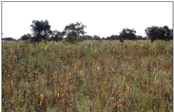
Les champs de maïs du village de Mubaya ont été en grande partie dévastés par la sécheresse.

Les premières pluies sont tombées au mois de janvier cette année, alors que la saison des pluies débute en principe dès la fin du mois d'octobre au Zimbabwe. En plus d'être trop tardives, les précipitations se sont avérées trop sporadiques pour permettre aux cours d'eau et aux réserves souterraines de se remplir. On estime qu'au moins 30% de la population du Zimbabwe est touchée par la faim et la soif dans les zones rurales.